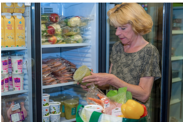
Informatie voor Klanten van de Voedselbank Houten

Bij de Voedselbank Houten mag u zelf uw pakket samenstellen. We hebben de producten klaargezet in onze 'winkel' en u neemt (gratis) mee wat u nodig heeft.